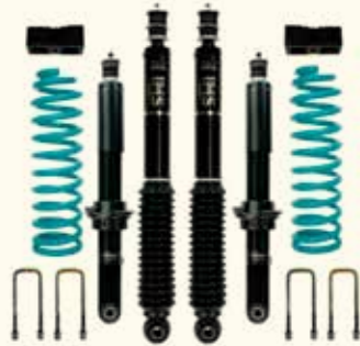
Quickride Monotubo IMS