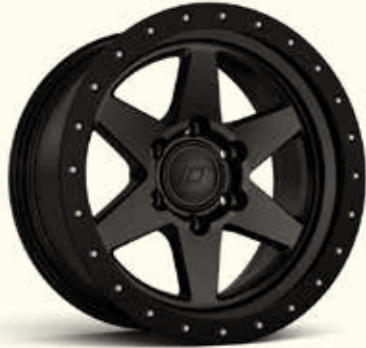
Matte Jet Black