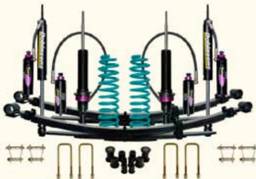
Confort-Load Monotubo MRA