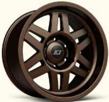
Matte Dark Bronze