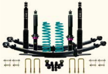
Confort-Load Monotubo IMS