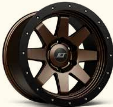
Matte Dark Bronze