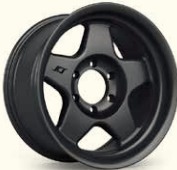
Matte Jet Black