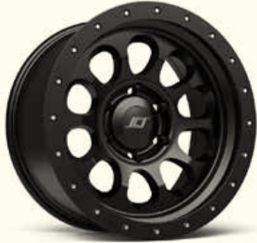
Matte Jet Black